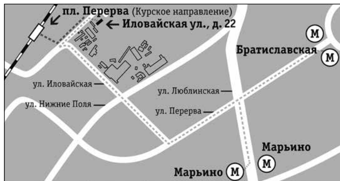
Иловайская улица, д. 22

Тел.: 8 (495) 720-15-08, 8 (499) 357-01-80.