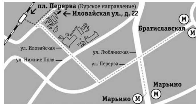
Иловайская улица, д. 22

Проезд: с Курского вокзала электропоездом до платформы Перерва, последний вагон, по ж/д мосту направо.